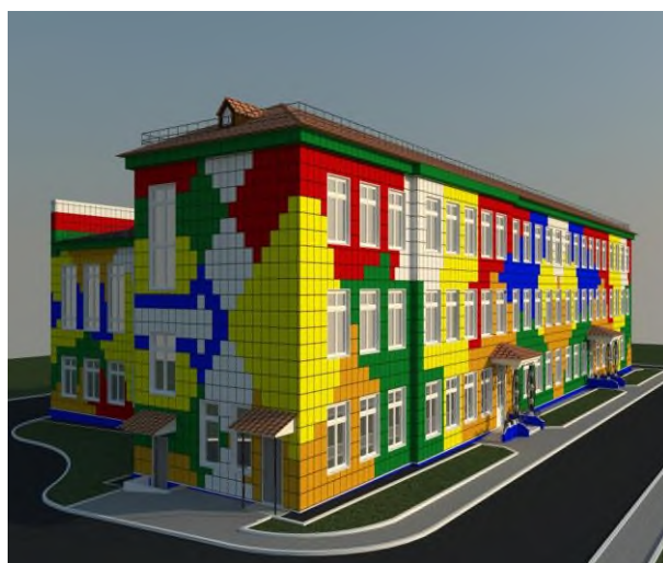
Детский сад - Костромская область, г. Галич, ул. Леднева, д. 52