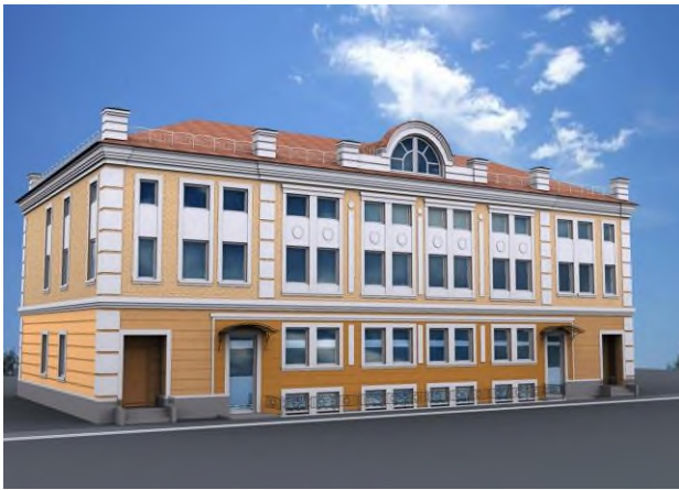
Реконструкция трёхэтажного офисного здания с цокольным этажом по адресу г. Иваново, ул. Станко

– Разработка проектов с привязкой паровых и водогрейных котлов, сосудов, работающих под давлением, трубопроводов пара и горячей воды.