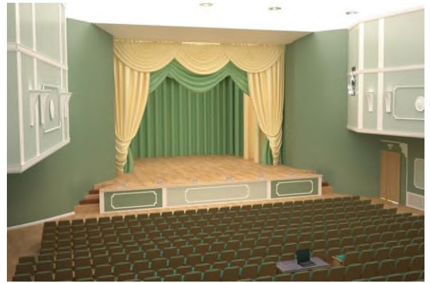
Интерьер – большой зал