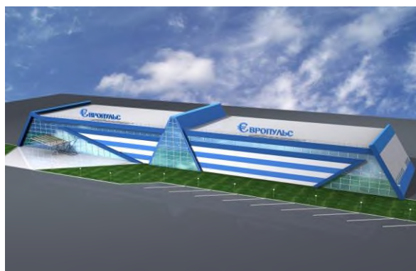
Реконструкция складского модуля под магазин оптово – розничной торговли по ул. Станкостроителей 1Г в г. Иваново.