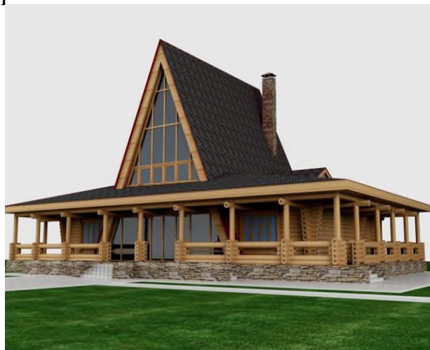
Индивидуальный жилой дом г. Иваново

– Проектирование инженерных сетей и систем: отопление, вентиляция, кондиционирование, водопровод и канализация.