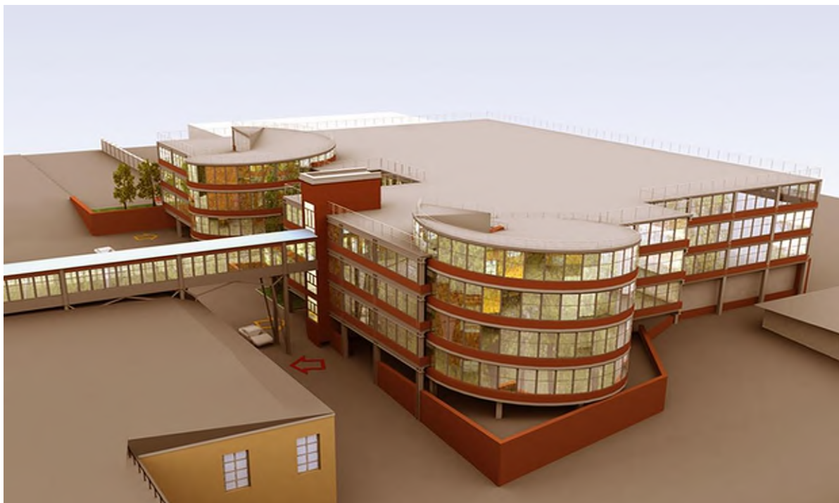
Многоуровневая стоянка на территории бывшей фабрики им. Кирова

– Разработка проектов производства строительно-монтажных работ и технологических карт погрузочно-разгрузочных работ грузоподъемными кранами.