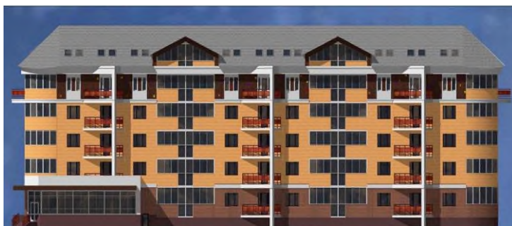
Многоэтажный жилой дом со встроенными нежилыми помещениями расположенный: Ив-я обл., гор. округ Кохма, ул. Ивановская, д.92.