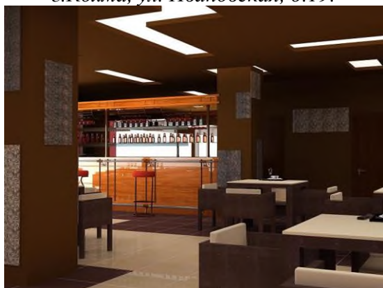
Интерьер – ресторан (бар)

Дворец культуры городского округа Кохма расположенный по адресу: г.Кохма, ул. Ивановская, д.19.