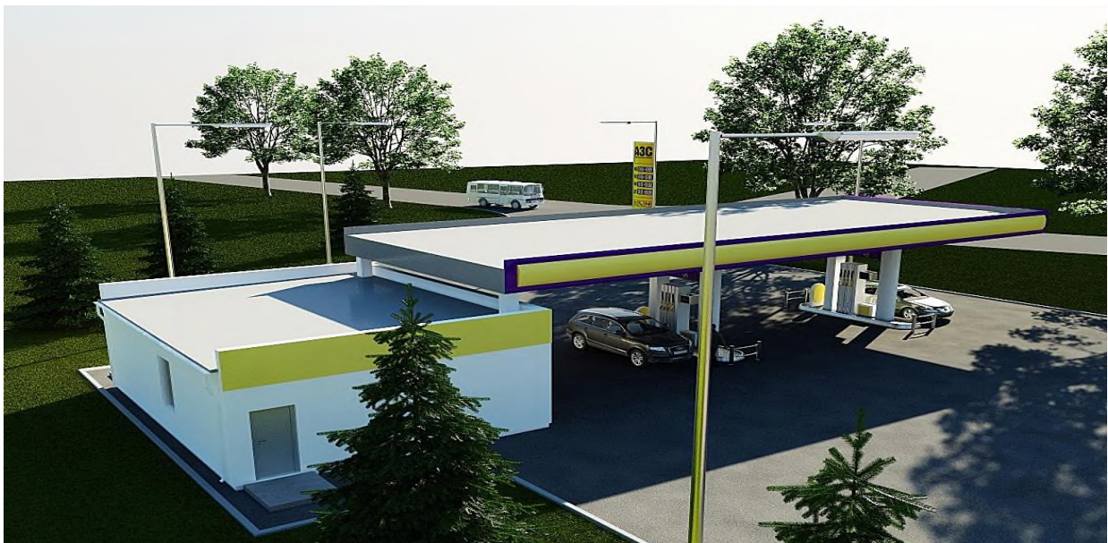
Автозаправочная станция со станцией технического обслуживания автомобилей