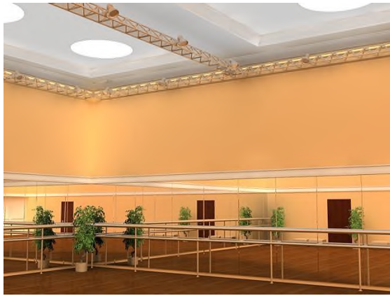
Интерьер – малый зал