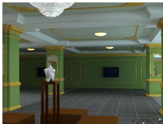
Интерьер – вестибюль