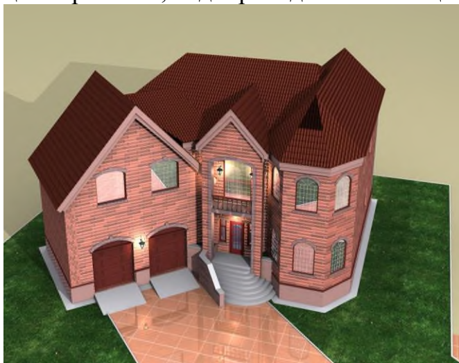
Индивидуальный жилой дом г. Иваново